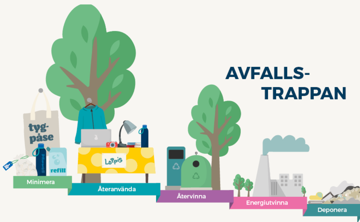
Illustration: Avfallstrappan (Seffle-Åmåls kommuner).